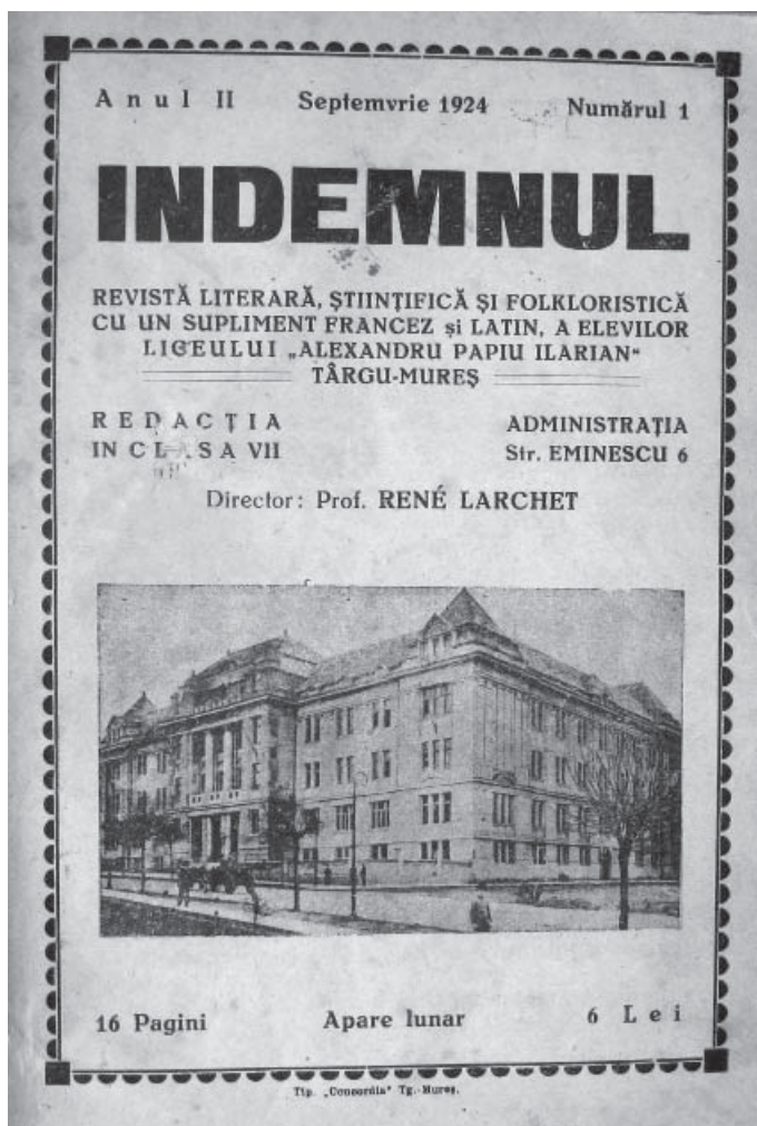
ÎNDEMNUL, Târgu-Mureș (1924-1927)