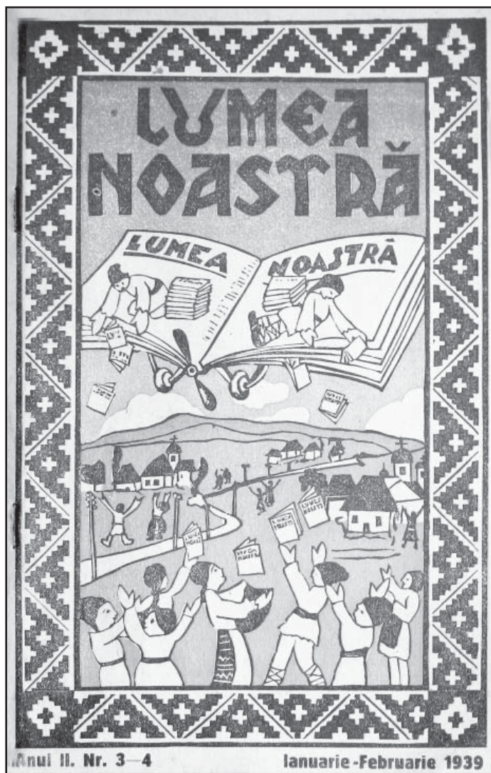
LUMEA NOASTRĂ , Târgu-Mureș (1938-1940)