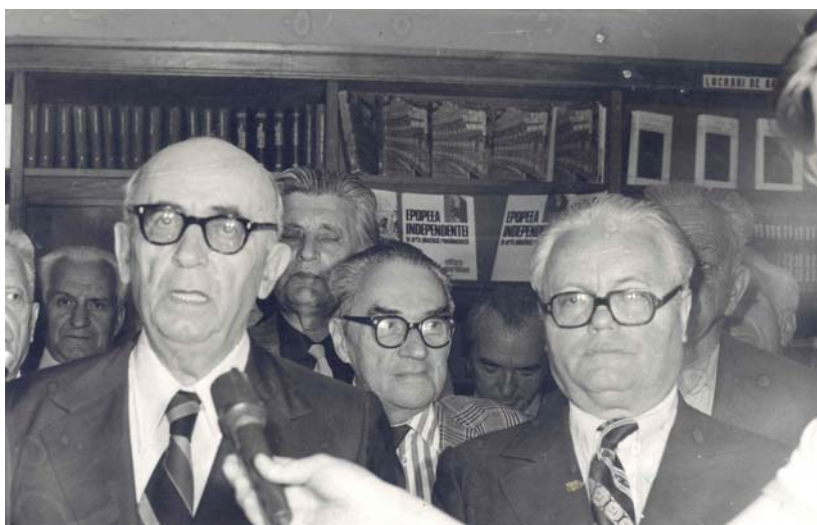
Vasile Netea și C.C. Giurescu