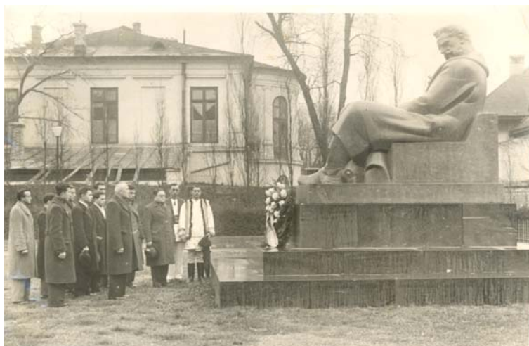
Grup de refugiați ardeleni la monumentul lui I.I.C. Brătianu, București (1943)