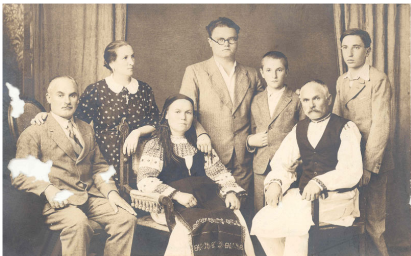
Fotografii de familie