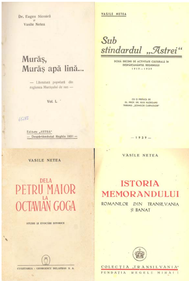
Lucrări ale lui Vasile Netea