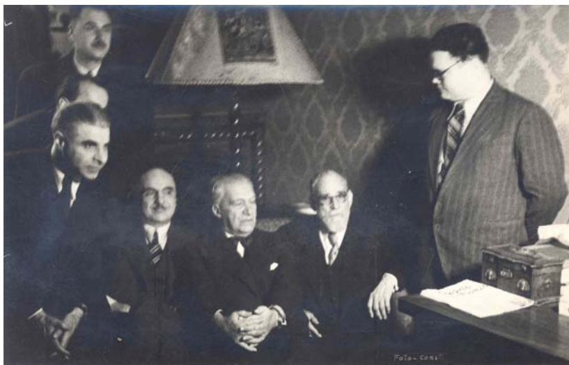
La aniversarea lui Dinu Brătianu (80 de ani de la naștere)