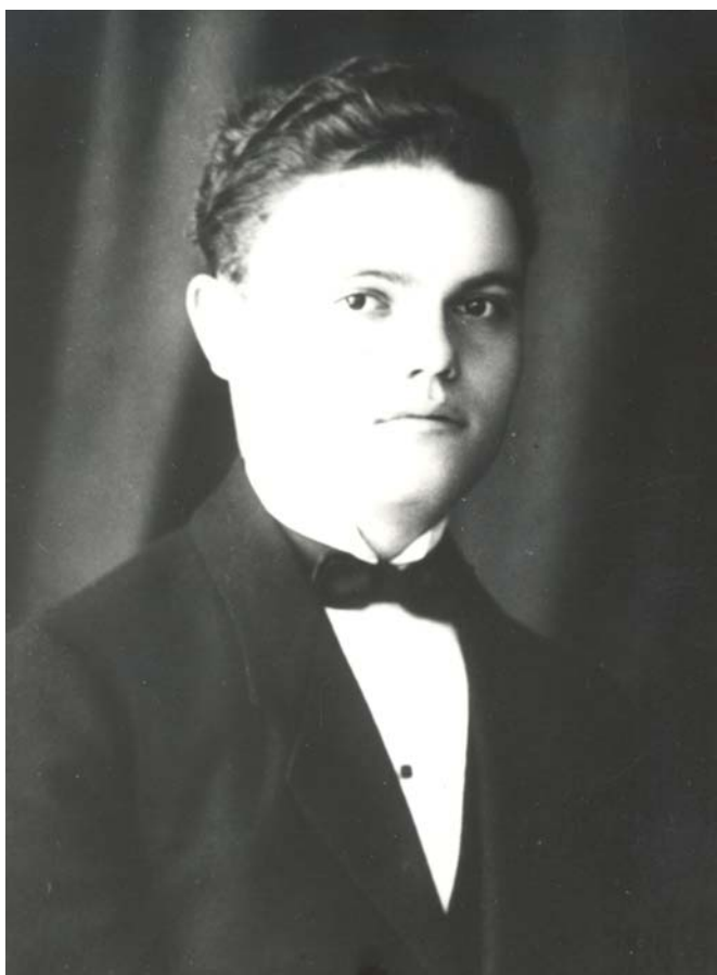
Absolvent al Școlii Normale de Învățători din Târgu-Mureș