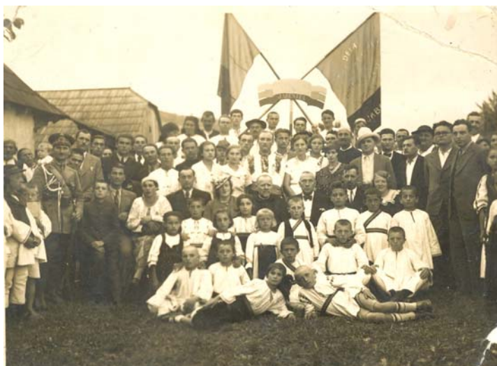
Membrii Căminului cultural "Octavian Goga" din Jabenita, jud. Mureș (1935)