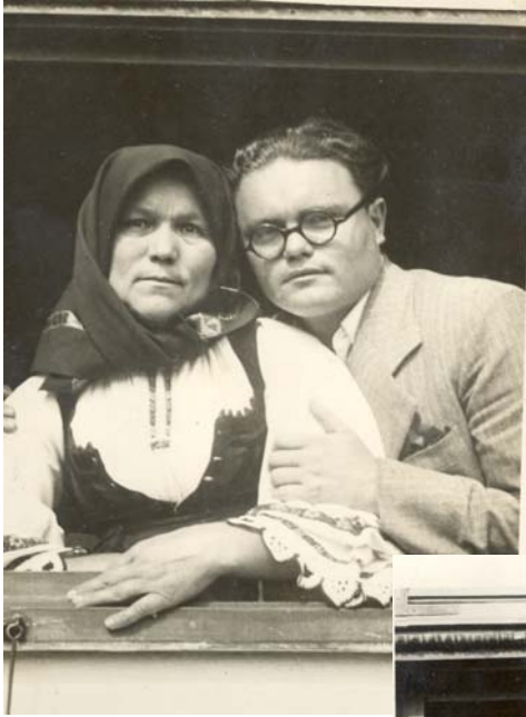
Cu mama sa