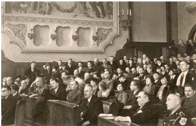
Congresul Tineretului Liberal Român din Târgu-Mureș (1938)