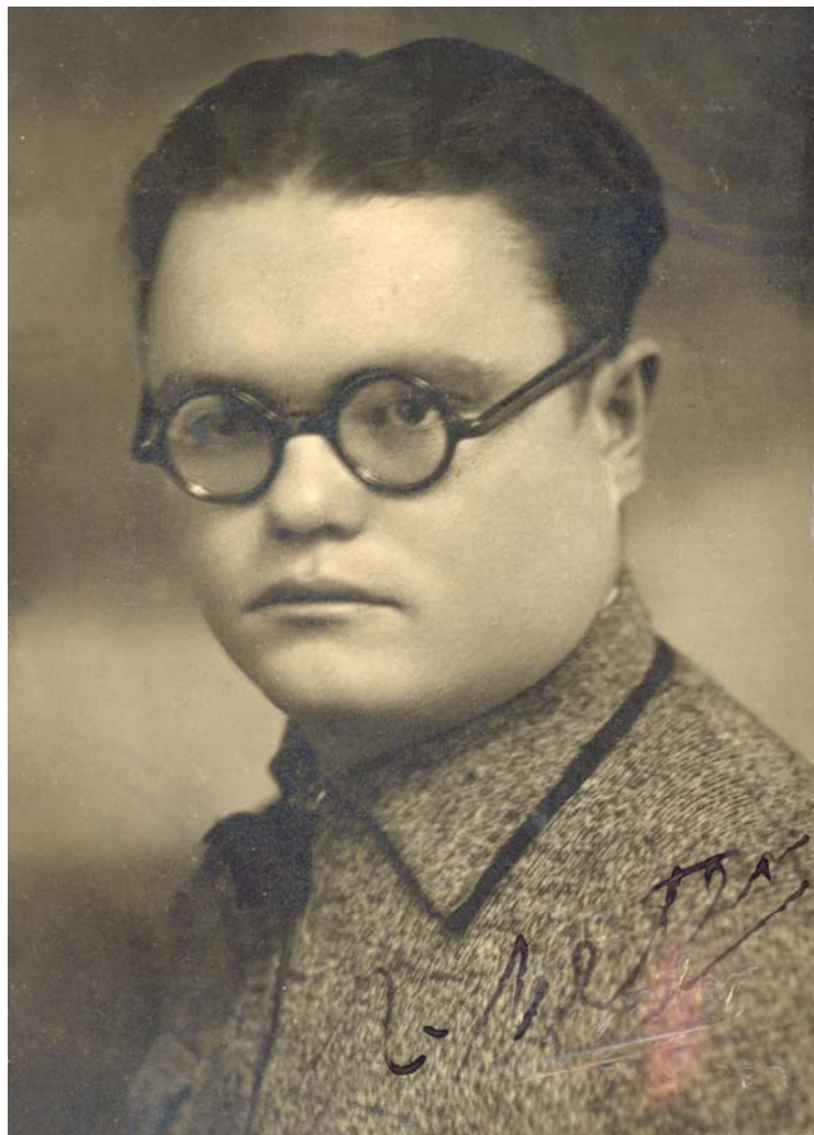
Vasile Netea în anul 1936