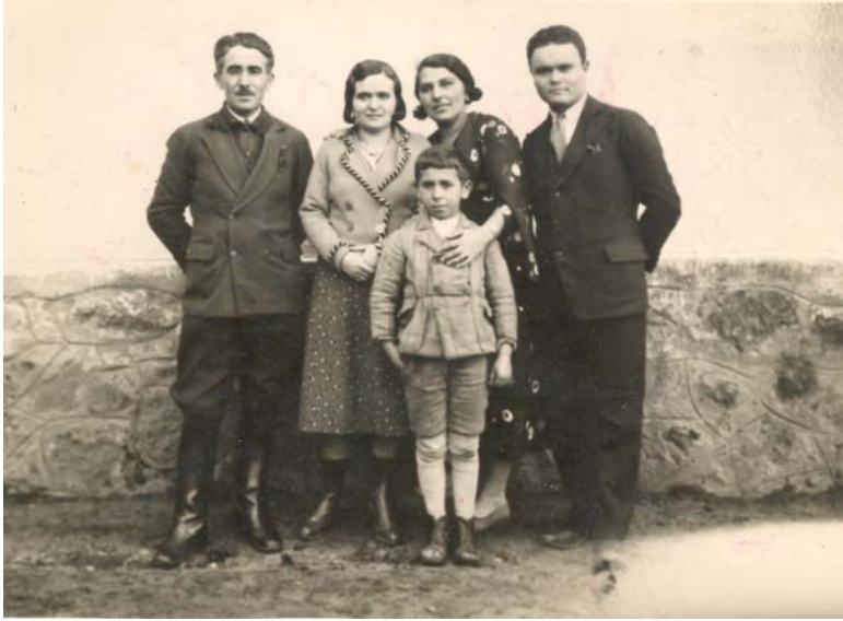
Învățătorii Școlii primare din Ierbuș – Reghin (1934)