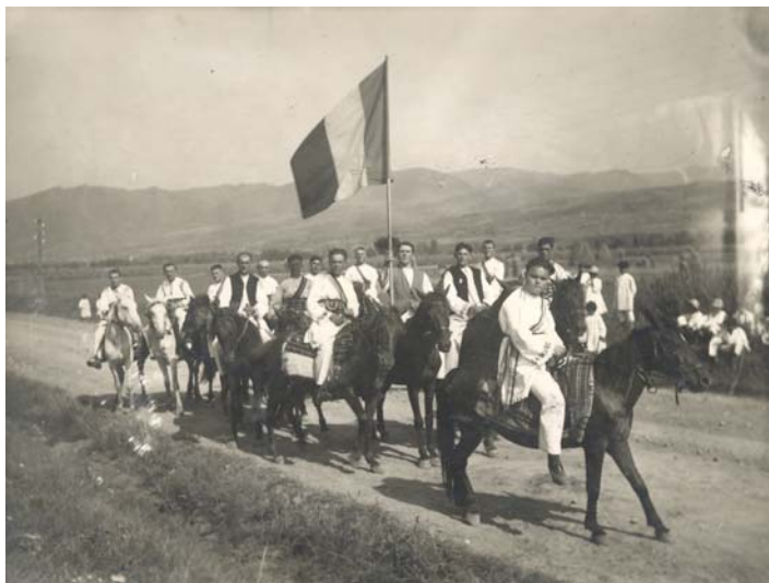
Călăreții din Deda (1935)