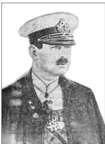
M.S. Regele Carol al II-lea

Se împlinesc cinci ani de când s-a coborât pe undele albastre ale văzduhului Făt-frumosul tronului românesc: Regele Carol II.