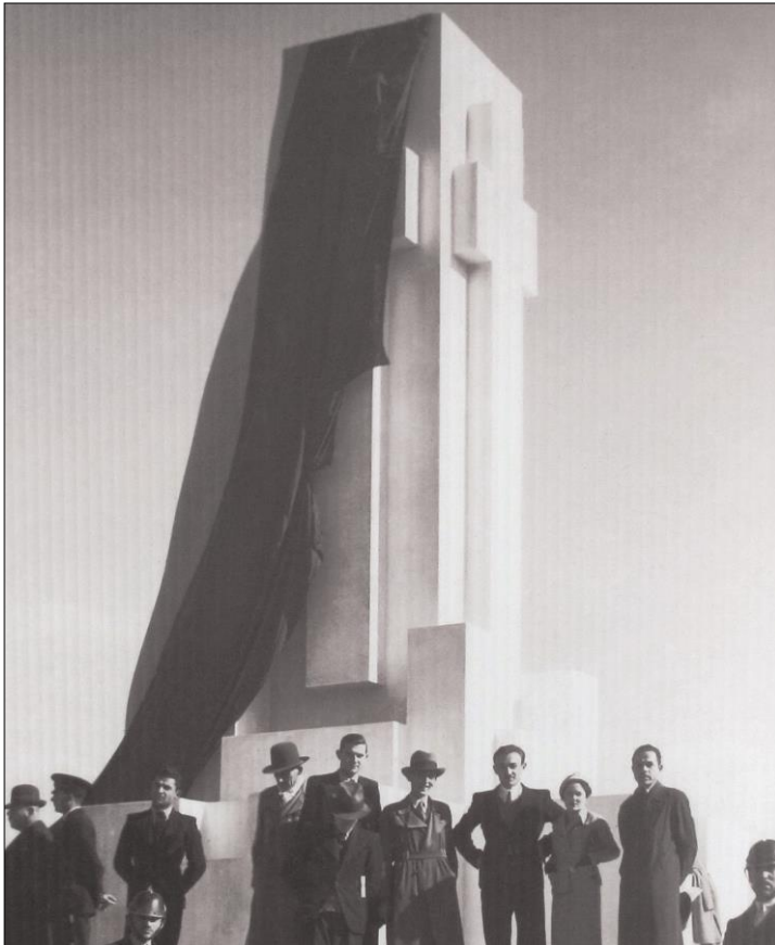
Monumentul lui Constantin Romanu-Vivu. Aspect de la inaugurarea din 14 septembrie 1936 la Sângeorgiu de Mureș. Monumentul a fost distrus în anul 1940.

Glasul Mureșului, III, nr. 48, 2 februarie 1936, pag. 1.