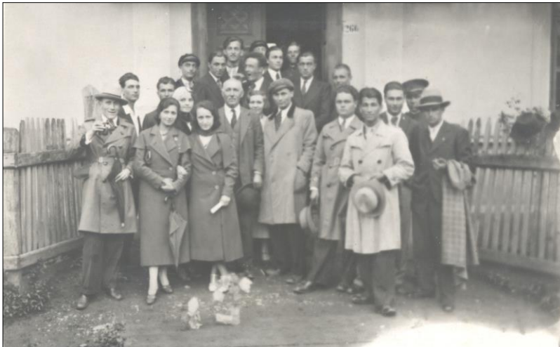
Membrii Societății „Tinerimea Română” din Reghin și jur, la Brâncovenești în 1933

Glasul Mureșului, III, nr. 76, 1 octombrie 1936, p. 2.