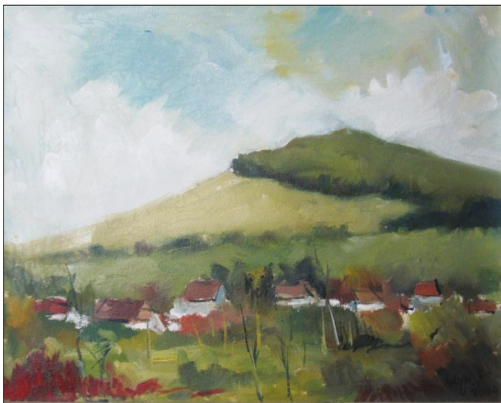
Dealul Pițigoilor, pictură de Ilarie Gh. Opreș