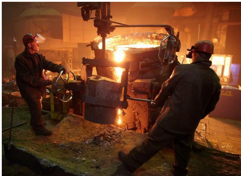
Am rezolvat problema vitezei de deplasare a podului rulant!

Dar în viață nu poți răzbi dacă nu ai câteodată și curajul de a risca. Duminica la ora 7.00 am dat startul, încet, calm, demontat , montat, la ora 12.00 eram gata cu o parte. Gata. Pauză de masă.