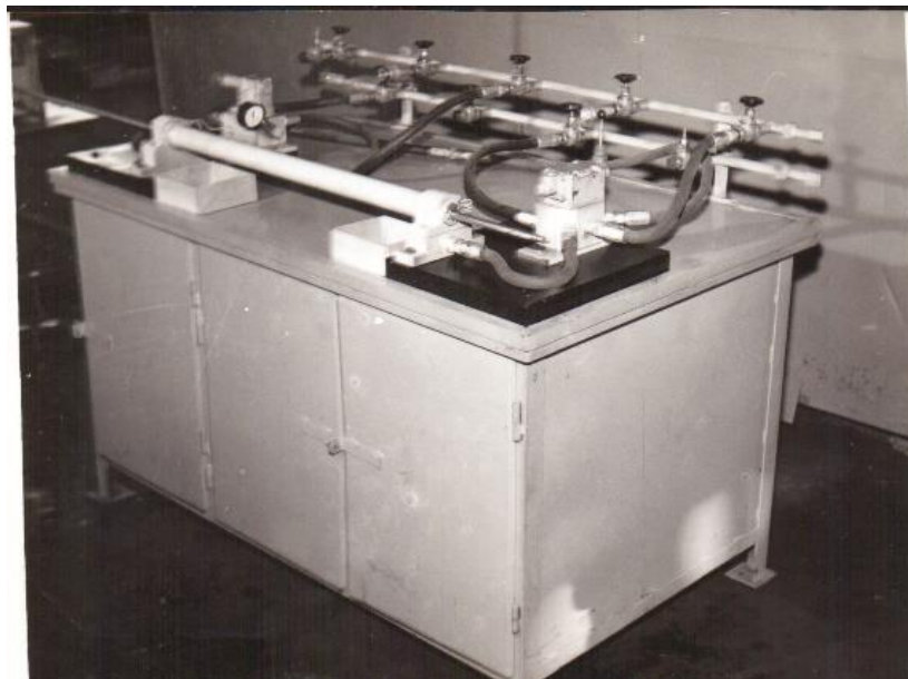
Ștandul pentru verificat elemente hidraulice!

De fapt ne ocupăm și de reparații și întreținerea și reparația grajdurilor și instalațiilor anexe, având un electrician cu aproape jumătate de normă acolo.