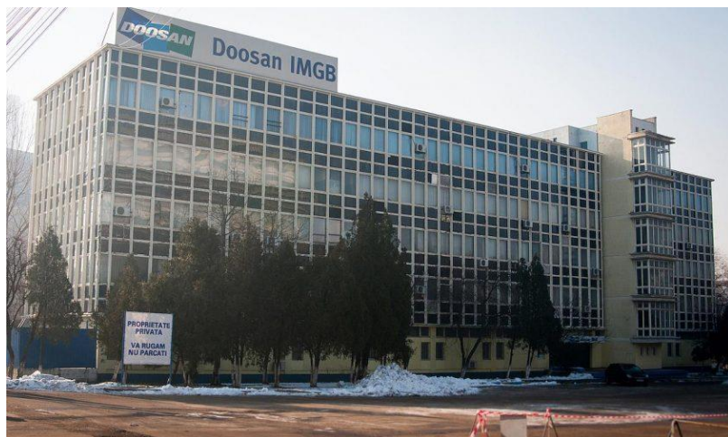
Noua față a fabricii

În 1998, a fost preluată de concernul norvegiano-britanic Kvaerner, pentru suma simbolică de 1 dolar. În 2006, Kvaerner a vândut-o grupului coreean Doosan Heavy Industries and Construction. Capacitatea maximă de producție este de 150.000 de tone, iar în cel mai bun an (2011) IMGB a atins o producție record de la Revoluție, de 96.000 de tone. În anul preluării, 2006, producția era în jurul a 20.000 de tone.