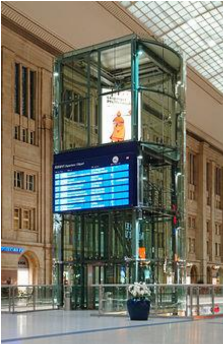
Ascensor la gara din Leipzig

Anul 1878 a venit cu o revoluție în istoria ascensoarelor, folosirea curentului electric. Această idee le-a venit inginerilor de la Siemens, din Germania. Cu toate acestea, ascensoarele electrice au început să se răspândească abia 9 ani mai târziu, mai ales pe continentul american și în Marea Britanie. La intrarea în secolul XX, compania Otis a inventat așa-numitul buton „Push”, care a ușurat folosirea ascensoarelor, prin faptul că nu mai era necesar personal care să acționeze ascensorul. În SUA printre primele coduri privind